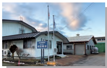
株式会社 相田商会 山形県米沢市川井字道下 2910 TEL 0238-28-1122(代表)

また、環境を考えプラスチックをゴミとしてではなく、新たな価値を持った資源として生み出していきます。かけがえのない地球、環境を汚染しないために徹底した活動に取り組み、社会貢献していきます。